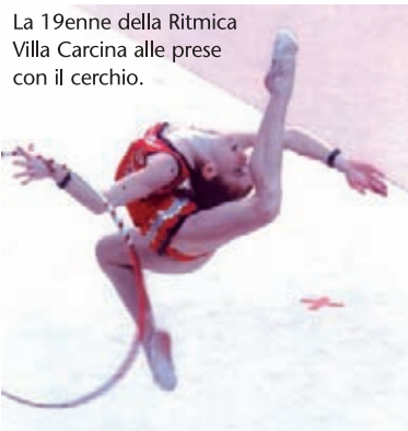
La 19enne della Ritmica Villa Carcina alle prese con il cerchio.