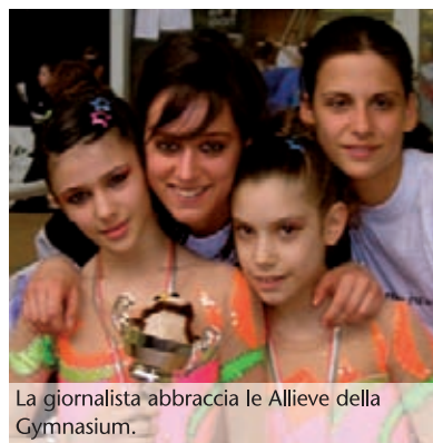
La giornalista abbraccia le Allieve della Gymnasium.

cora oggi, se le chiedi cosa ricorda di me, lei ti risponderà che mi occupavo di pettinarla e farle lo chignon durante i collegiali estivi a Sondrio. Alla mattina arrivava con sorriso e spazzola in mano e io le sistemavo i lunghi capelli rossi. Diceva che ero brava, perché non le facevo male!". E questo rapporto di amicizia e scambio si è poi ri-